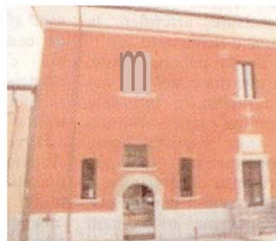
Il Geobiolab a Benevento

di ArtSannio, va ricordato che la Provincia ha avviato da tempo una ricognizione delle agenzie, una delle quali, la Marsec, è già stata collocata sul mercato. In questo contesto potrebbe inserirsi la mancata proroga dei contratti a partire dall' 1 gennaio scorso dei collaboratori che lavorano nei citati musei. Circostanza che potrebbe non essere influente nella decisione di stoppare temporaneamente la fruibilità delle strutture.