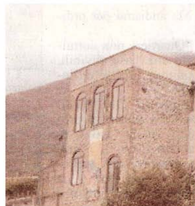
I Meg di Solopaca

di ArtSannio, va ricordato che la Provincia ha avviato da tempo una ricognizione delle agenzie, una delle quali, la Marsec, è già stata collocata sul mercato. In questo contesto potrebbe inserirsi la mancata proroga dei contratti a partire dall' 1 gennaio scorso dei collaboratori che lavorano nei citati musei. Circostanza che potrebbe non essere influente nella decisione di stoppare temporaneamente la fruibilità delle strutture.